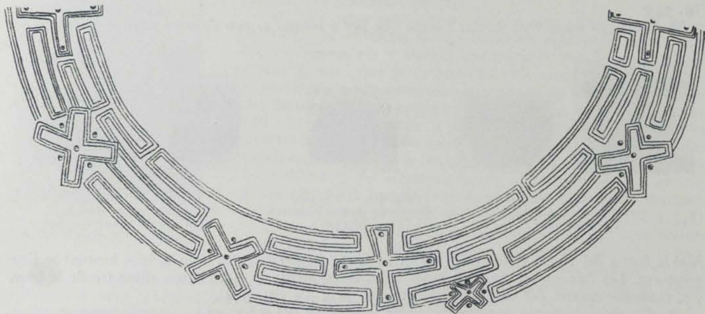
Fig. 349. — Desenrotllo de la decoració d'una urna de Can Missert

material trobat en les nostres excavacions confirma la posició de Terrassa en el primer període de la primera Edat del ferro de Catalunya representant-ne l'apogeu juntament amb la necròpolis veïna de Sabadell. Aquest primer període, com ja s'establí en altres llocs (1), es correspon